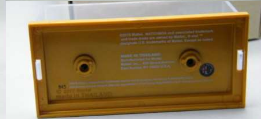
Alfa Romeo Giulia „Happy Holidays 2019“ – very rare Mattel employee exclusive model!