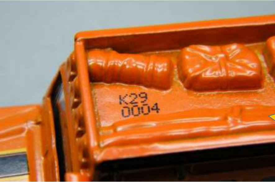
Land Rover Globe Travellers FEP