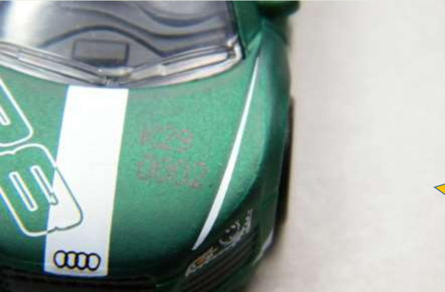
Audi R8 Globe Travellers FEP