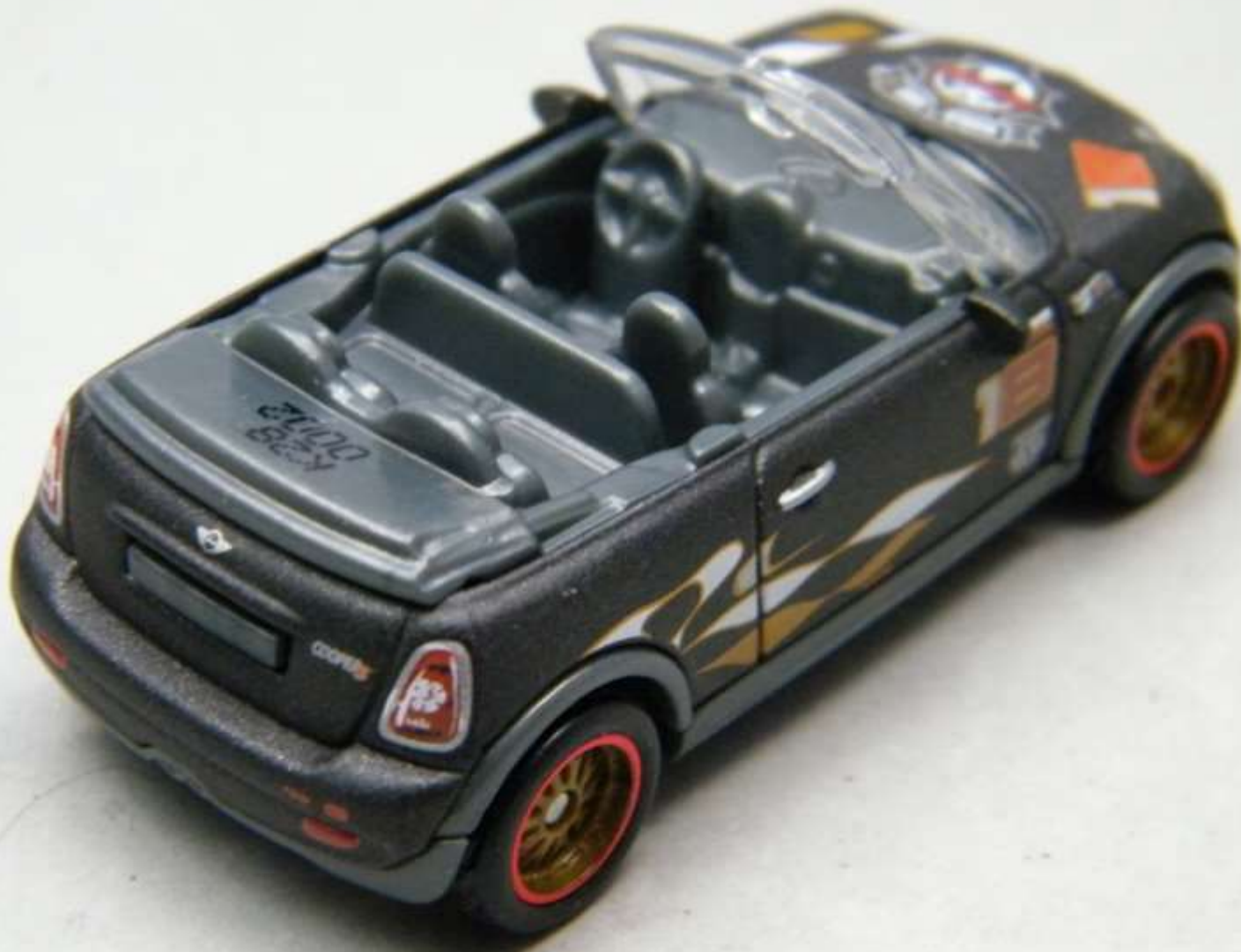
Mini Cabrio FEP Globe Travellers