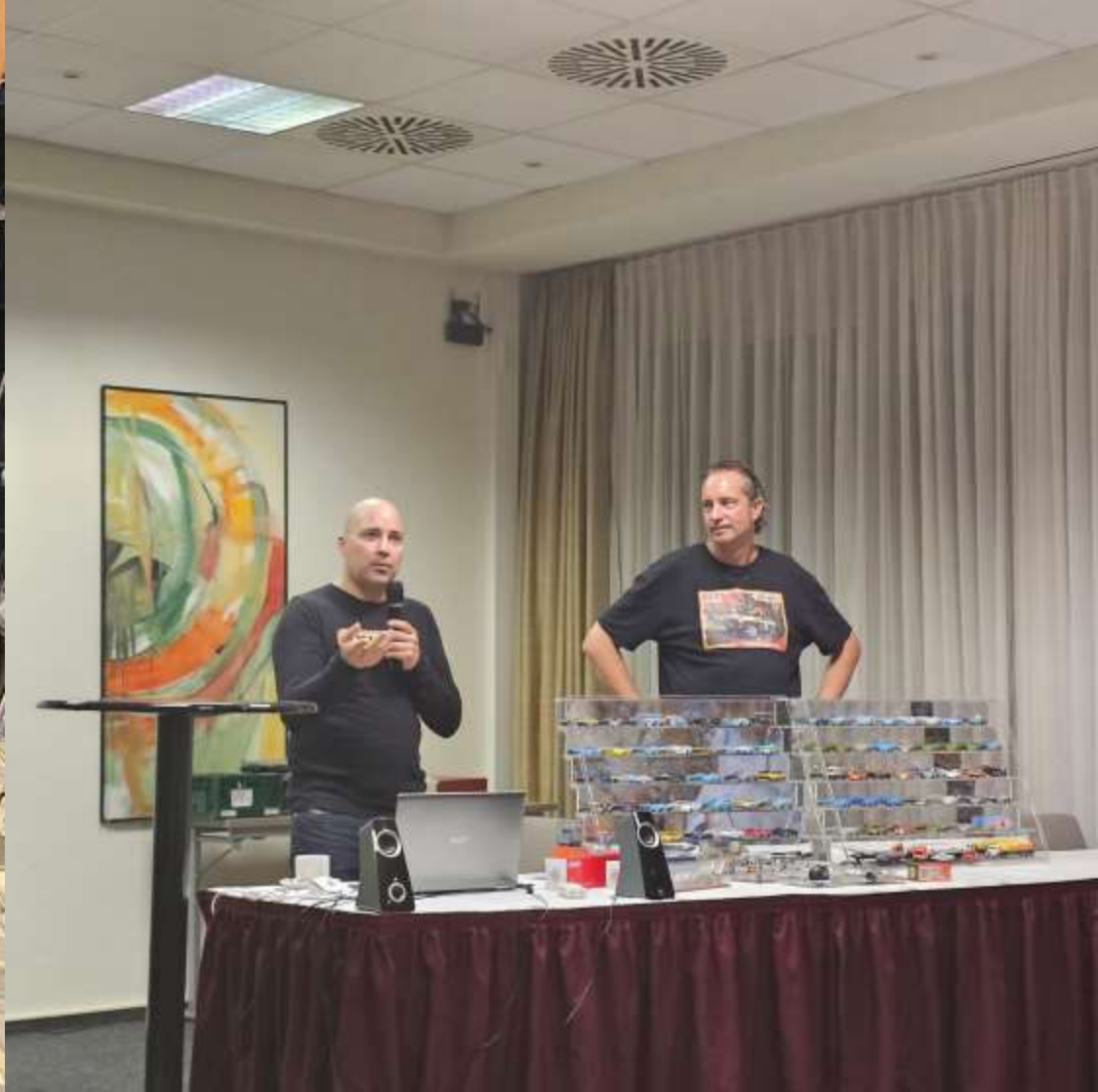
Einfach mal ein paar Impressionen aus dem Ballsaal im Hotel vom Matchbox-Sammlertreffen – hier die Modell-Präsentation Teil 1