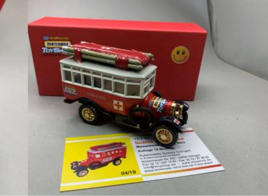
MoY-Clubmodell Scania Ambulance von der Messe – nur 9 Modelle in blauer Box (€89) und 6 in roter Box (€99) wurden hergestellt – bis auf ein paar sind die schon auf der Messe weggegangen!