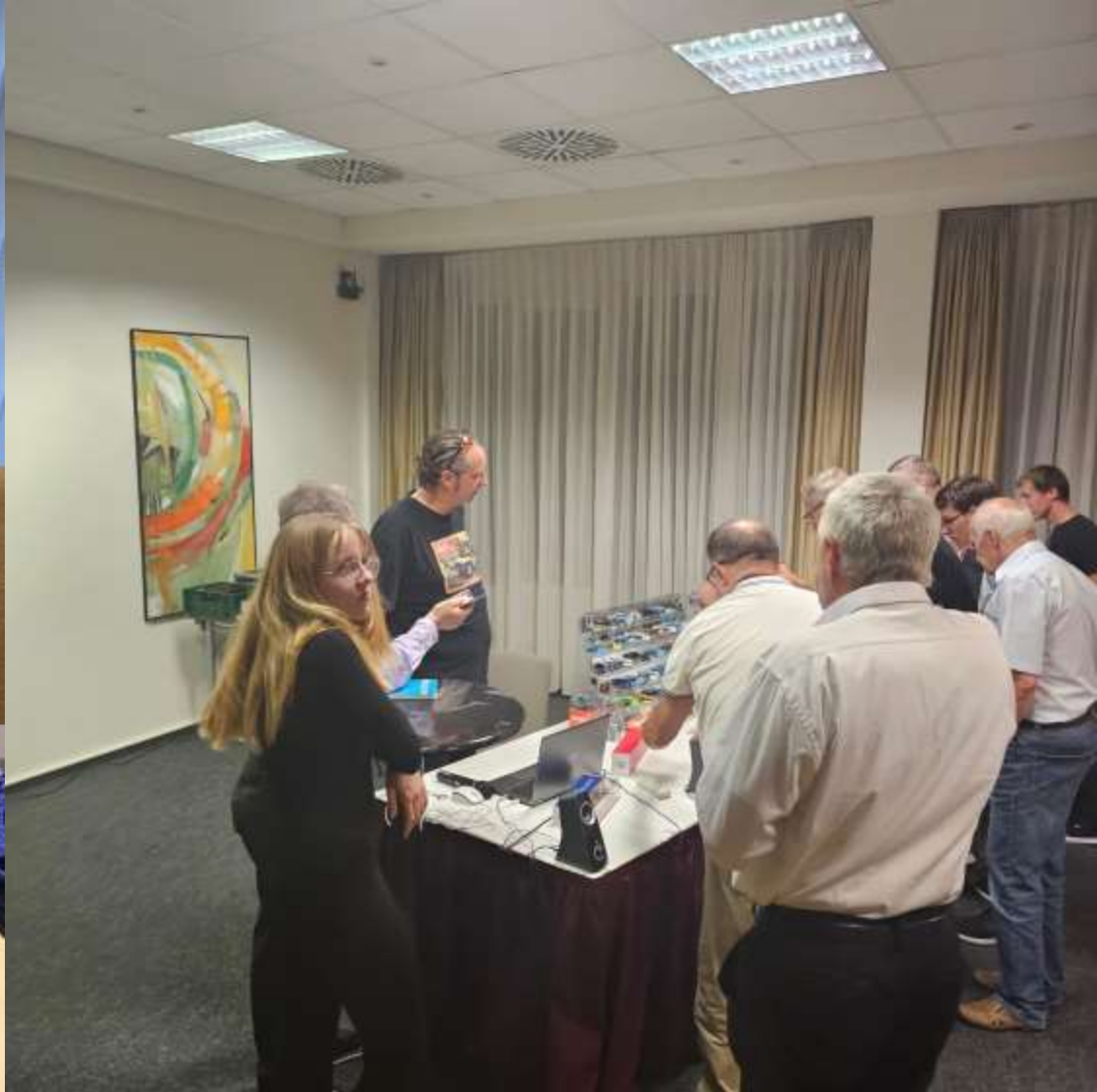
Einfach mal ein paar Impressionen aus dem Ballsaal im Hotel vom Matchbox-Sammlertreffen – hier die Modell-Präsentation Teil 2