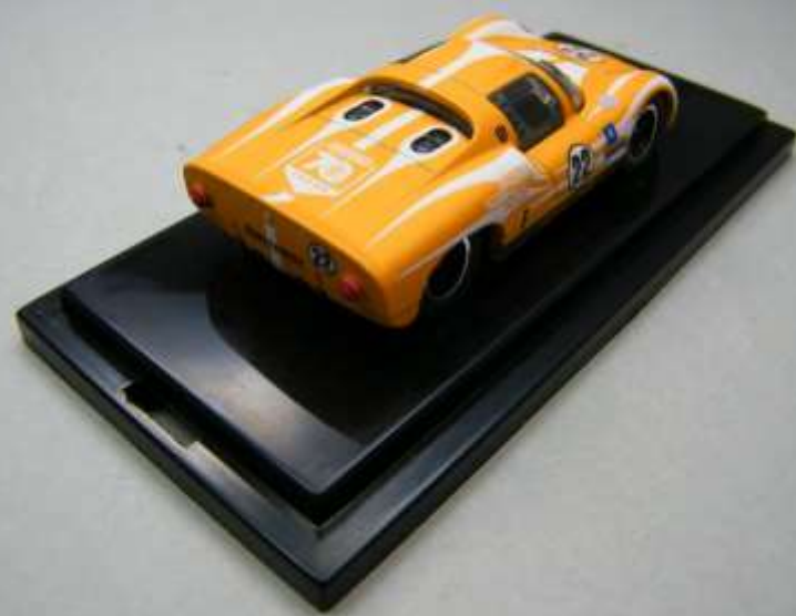
300 Stück orange – Version A