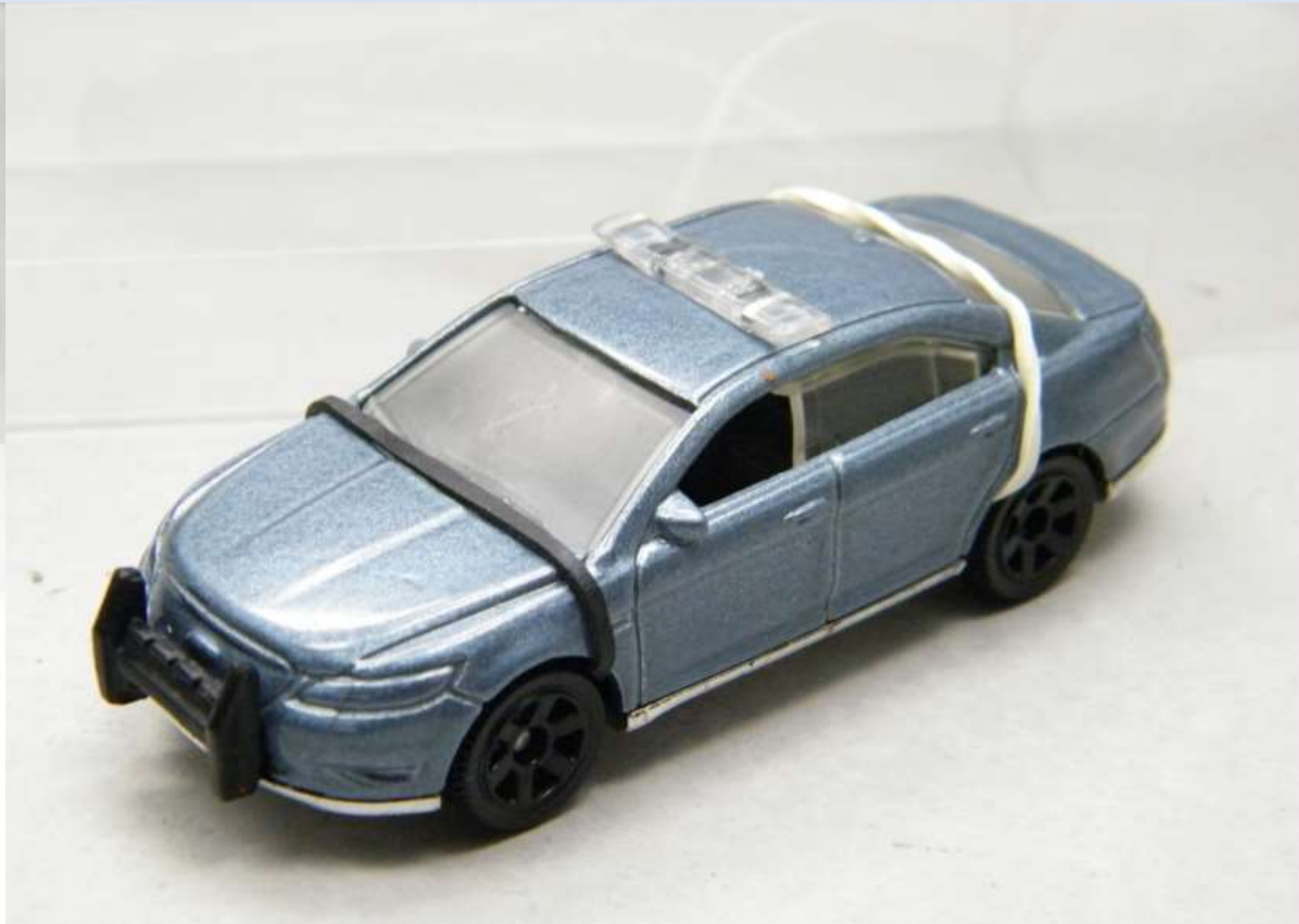
Ford Police PreProduction