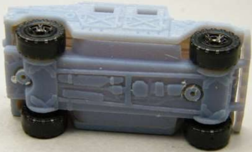
Hummer H1 3D PreProduction