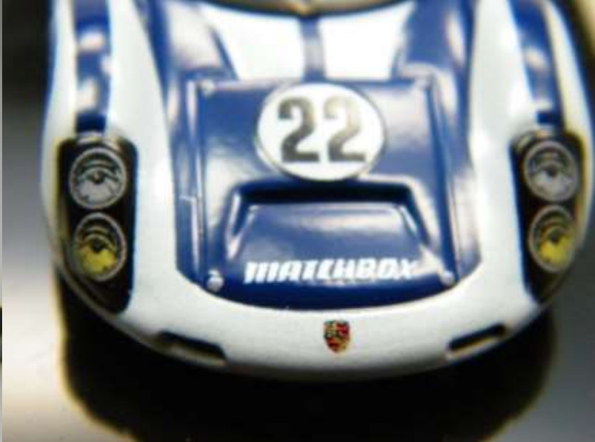
75 Stück blau – Version C