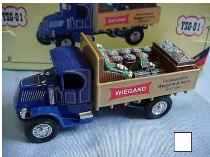
YSG-01 Mack Lieferwagen „Feinkostfabrik Wiegand“ Das erste Modell der Serie „Klingenstadt Solingen“ (SG) ist dieser Mack Fischlaster. Die Firma Wiegand stellte zunächst Dosenfisch her – mittlerweile liegt der Schwerpunkt auf Ketchup, Majo und Dressing. Preis € 29,90