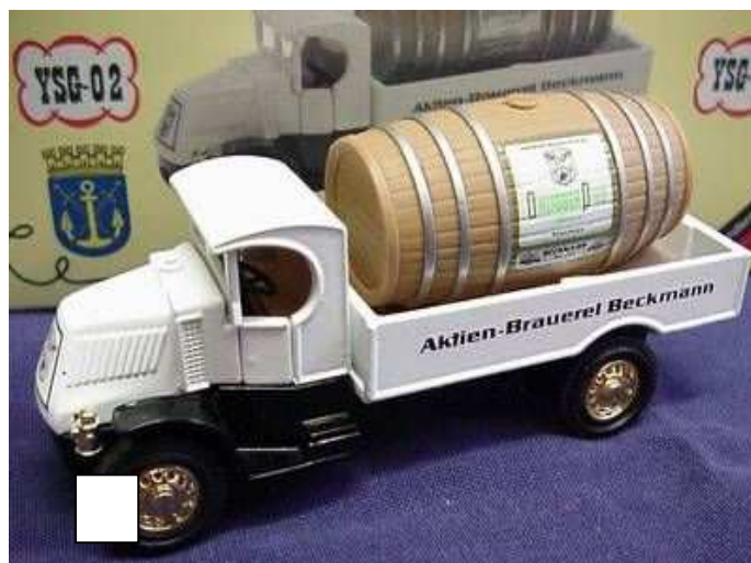
YSG-02 Mack Lieferwagen „Beckmann Brauerei“ Das zweite Modell der Serie „Klingenstadt Solingen“ (SG) ist dieser Mack Bierlaster. Die Beckmann Brauerei war die Solinger Privatbrauerei, die im Zuge der Konzernbildungen bei Brauereien aufgegeben wurde. Preis € 39,90