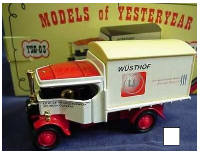
YSG-03 Foden Lastwagen „Wüsthof“ Das dritte Modell der Serie „Klingenstadt Solingen“ (SG) ist dieser Foden Dampflastwagen „Wüsthof“. Neben den bekannten Zwillingen ist die Marke „Dreizack“ sicherlich das bekannteste Solinger Aushängeschild. Preis € 39,90