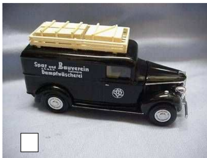
YSG-04 GMC „Spar und Bauverein Solingen“ Der Spar- und Bauverein Solingen hat eine lange Geschichte. Neben Wohnraum gab es im Weegerhof zu Solingen auch eine Großwascherei. Das Modell basiert auf einer Abbildung des Originalfahrzeuges. Preis € 39,90