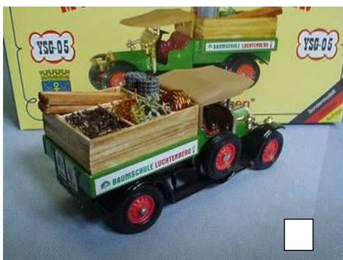
YSG-05 Crossley „Baumschule Luchtenberg“ Das fünfte Modell aus der Serie ist dieser Crossley für die Baumschule Luchtenberg. Die Ladung wurde in feinsten Handarbeit hergestellt. Das Modell ist vergriffen. Preis a.A.